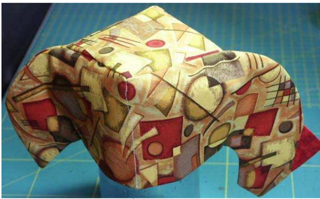
Piqûre Photo 7